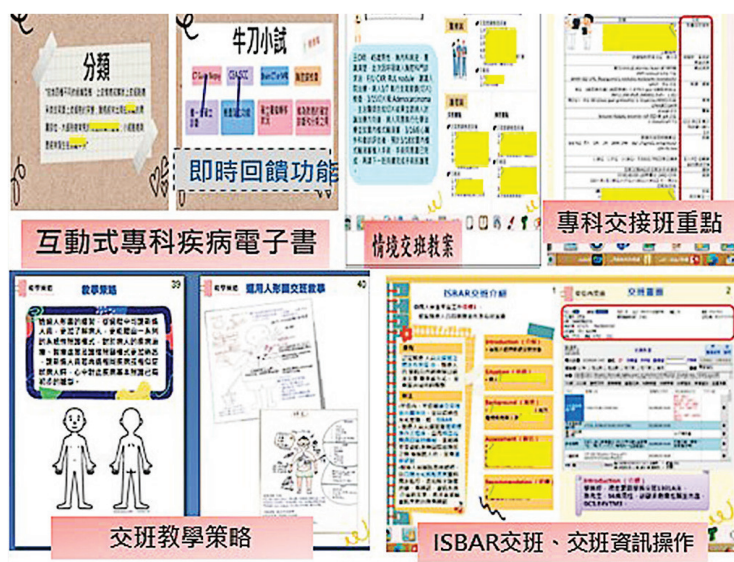
圖三：互動式電子書內容