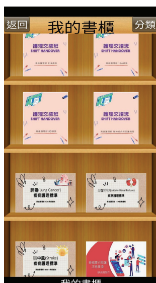
圖二：手機板個人電子書櫃